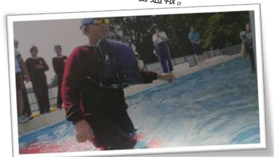
ランドセルを使った複合練習、通学途中を想定した練習です。