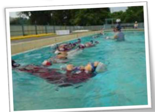
身近な浮き具（ペットボトル）を使った背浮きの練習風景。