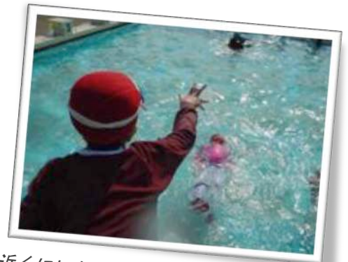
近くにいた人は浮き具を投げ、受け取る練習、そして119番通報。